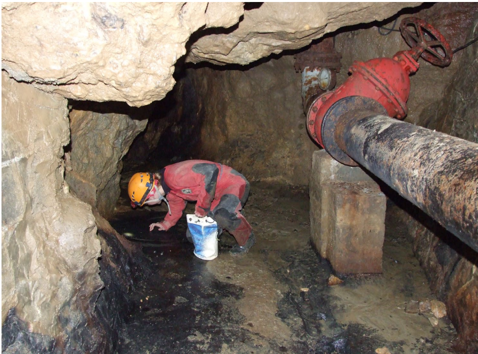
1. kép. Részlet a mesterséges tároból.

2010. november és 2011. október között négy alkalommal vizsgáltam a Mánfai-kőlyukban, ebből egy ízben csak fotódokumentációt készítettem